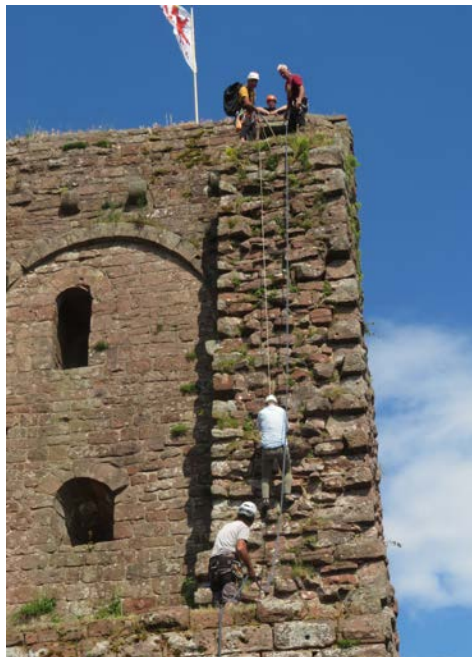
Dernière longueur

3. Le matos a été fourni par le Club Alpin de Strasbourg.