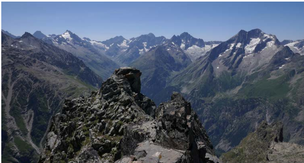
Au sommet, sur fond de vallon de la Lavey

Pour l'heure, nous détournons le regard et décidons de nous attaquer à l'ascension finale. La belle surprise, c'est l'absence totale de balisage ; pas même un petit cairn, si ce n'est celui qui coiffe la cime... et c'est le plaisir indéfinissable d'imaginer par où ça passe (les indications sur internet n'étant guère utiles)... et de passer ! quitte parfois à revenir sur nos pas en cas de fausse piste... L'escalade en elle-même est vraiment facile, mais exposée au vide : il faut rester concentré. Toutes ces difficultés ne font que décupler le bonheur de fouler cette cime escarpée – même si la vue n'y est guère plus étendue que depuis le col ; au mieux le Pic Gaspard se laisse entr'apercevoir au-delà des Têtes du Replat. Je me dis alors qu'il devrait y avoir plus de montagnes exemptes de tout balisage, pour le bonheur des personnes un poil aventureuses qui prennent leur pied dans la recherche d'itinéraire, tout comme je souhaiterais plus de grandes voies d'escalade déséquipées, pour les amoureux du « trad ». A moins que je ne sois qu'une exception ? Mais assez philosophé, nous redescendons au col