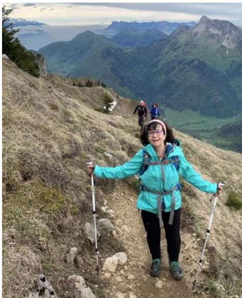
Montée au Trelod

boucher sur de beaux pâturages, avant d'atteindre le col de la Cochette.