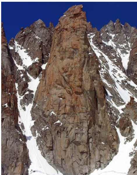
Le Grand Capucin