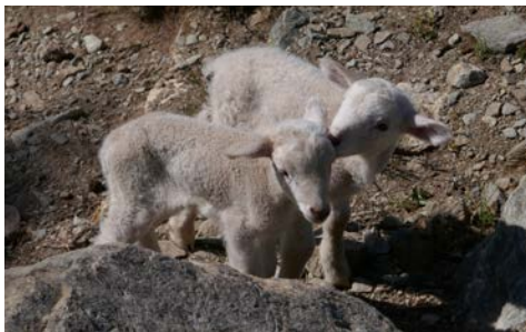
Rencontre avec nos deux agnelets

les alentours. Plus surprenant encore, ils montent vers nous, jusqu'à se frotter à nos jambes... avec un regard que je qualifierais de désespéré. Il est clair qu'ils ont perdu leur troupeau. Que faire ? Nous repartons, espérant que leur mère finira par les retrouver... Mais les voilà qui commencent à nous suivre... ce qui sans doute ne fera que les éloigner un peu plus de leurs semblables ; nous essayons de les en décourager, sans succès, jusqu'à ce que la fatigue finisse par les contraindre à stopper. Cette fois nous continuons sans eux, convaincus qu'au retour ils seront en sécurité auprès des leurs, d'autant que nous avons entendu au loin des bruits de clochettes.