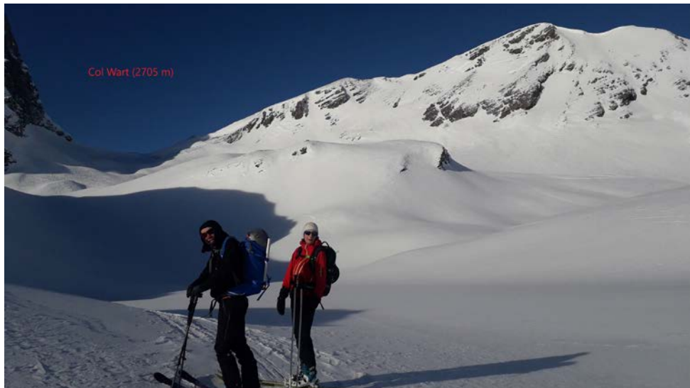
Vue sur le col et le Wildgärst à droite