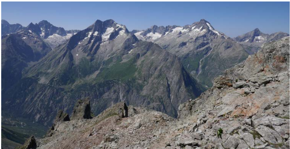
Depuis le col, côté sud le charme de l'Oisans