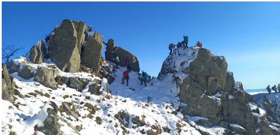
Sur les Spitzkoepfe

Après une boisson chaude, qui nous donne l'occasion de discuter, c'est maintenant l'heure des entretiens. Nous défilerons l'une après l'autre afin de montrer notre motivation, d'expliquer notre projet, d'échanger sur nos expériences et les raisons qui nous poussent à intégrer ce groupe 100% féminin ; et c'est enfin l'heure de la fondue !