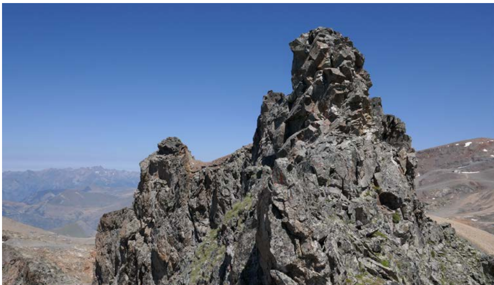
Tête de la Toura, une cime escarpée

Lorsque nous parvenons au col, nous sommes partagés. Côté sud, nous sommes comblés par le panorama grandiose sur la Pointe du Vallon des Etages, la Tête des Fétoules, l'Olan, l'Aiguille des Arias, la Tête de Lauranoure, la Roche de la Muzelle, le Rochail... ou plus près au sud-est l'imposante Aiguille du Plat de la Selle. Mais au nord... hormis une vue lointaine sur Belledonne et les Grandes Rousses, c'est l'apocalypse (!), ou ce que l'Homme est capable de faire de pire lorsqu'il s'approprie la montagne ; en fait nous avons une vue imprenable sur une grande partie du domaine skiable des Deux-Alpes, du Jandri à Tête Moute, et nous n'y voyons que d'immenses champs de cailloux, en train d'être nivelés et re-nivelés par une armée de bulldozers surpuissants. J'aime le ski, mais pas à ce prix-là... quand comprendrons-nous que vivre avec la nature ne veut pas dire en faire notre jouet avec lequel tout est permis ? En attendant, les bruits des moteurs sont les seuls témoignages de vie autour de nous... étonnant contraste.