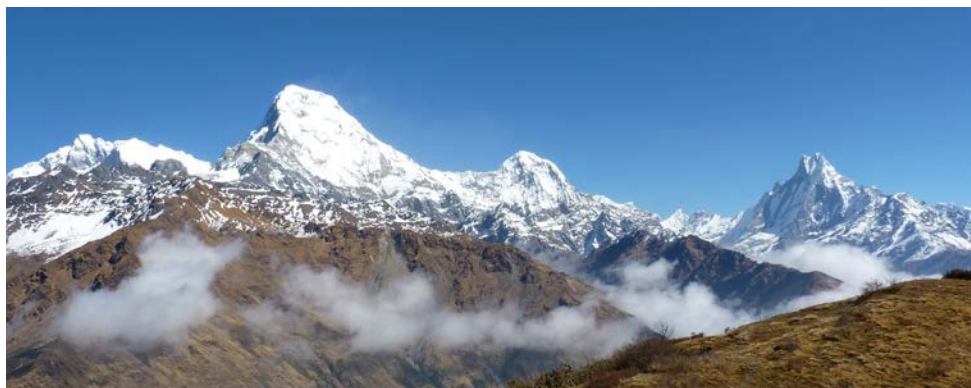
Le Machapuchare 6993 m en ligne de mire à droite

Pour les sorties hors de France , afin d'éviter d'avancer les frais en cas de soins, il est fortement conseillé de se munir d'une carte européenne d'assurance maladie (valable 2 ans, délivrée gratuitement par votre caisse ou votre mutuelle dans un délai de 15 jours).