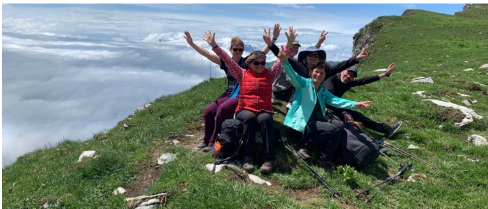
Col d'ARCLUSAZ 1770 m