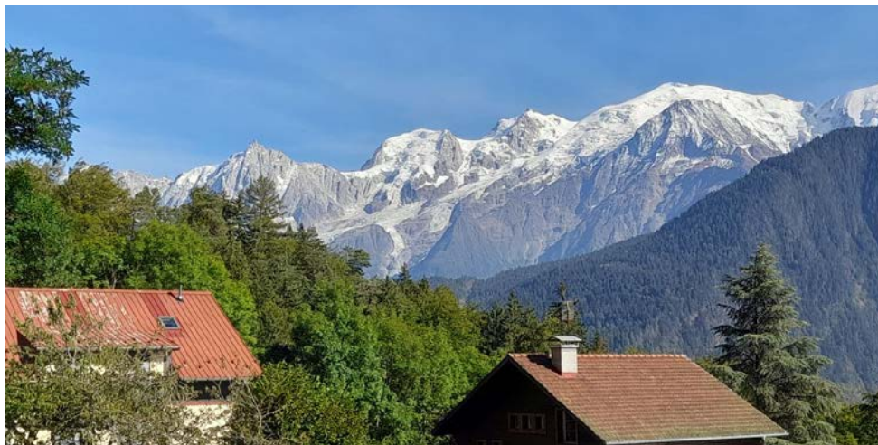
Le Mont-Blanc et sa suite vu du plateau d'Assy

Benoît Gross tél. 03 88 96 93 22 e.mail : benoit.gross@wanadoo.fr