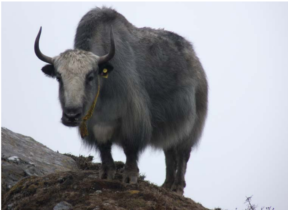
Yak yak yak

Inscription souhaitée auprès de Didier Spiegel (0619948272 ou didier.spiegel@orange.fr )