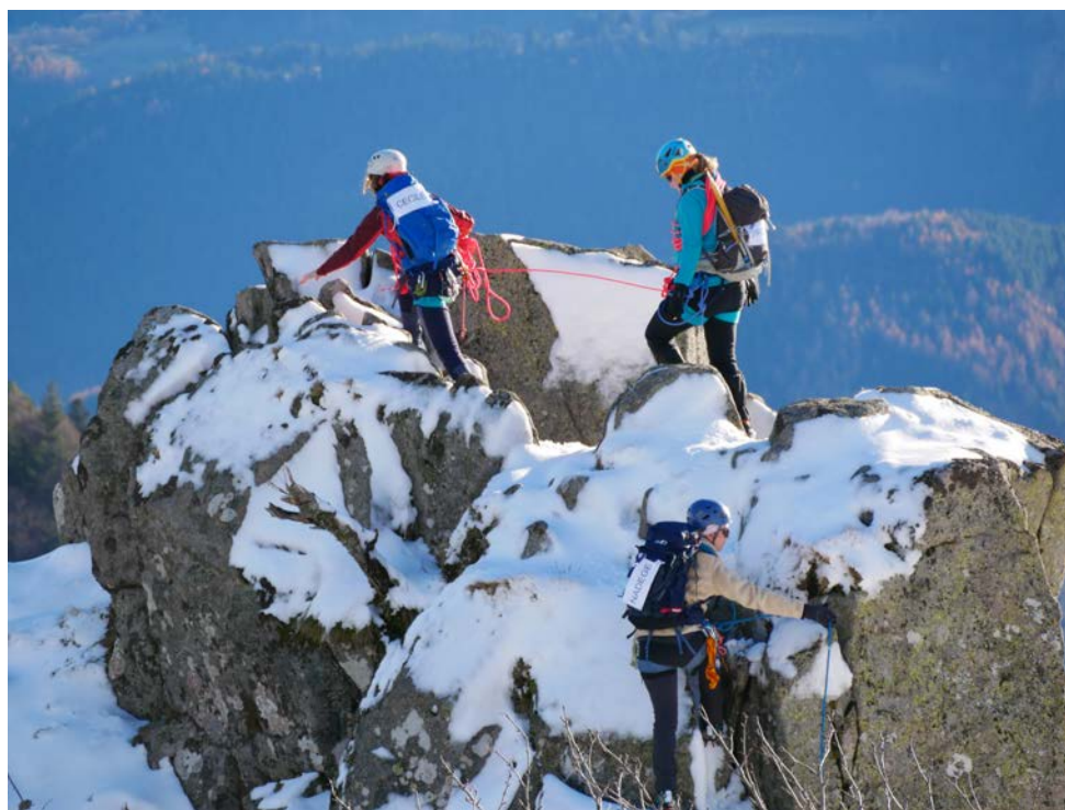
Les candidates au groupe CAF GIRLS à l'assaut des Spitzkoepfe