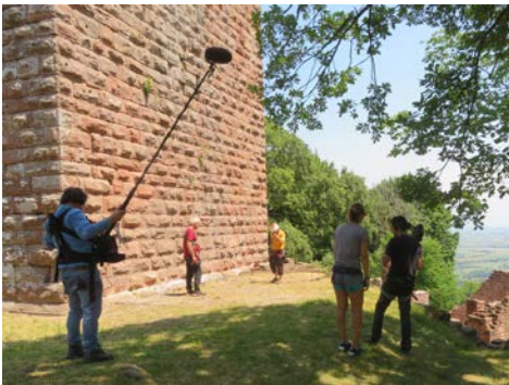
L'équipe est en place le tournage peut commencer

Le rendez-vous est fixé à 10h00 et l'équipe arrive à midi comme il se doit ! L'équipe est composée des deux architectes, d'un caméraman, d'un ingénieur du son, qui pilotera également le drone, et de la réalisatrice - plutôt l'antithèse d'Orson Wells - en tenue décontractée, short et jambes à faire pâlir Angie Dickinson dans Rio Bravo.