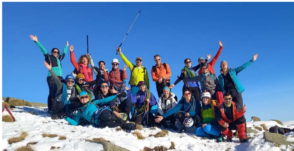
Le groupe