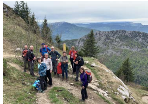
Montée au Trélod

Nous laisserons le Rocher de la Bade (via ferrata) sur notre gauche, pour dé-