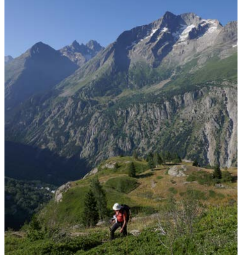
Au dessus du Miroir des Fétoules la Tête de Lauranoure

La chance nous sourit : le beau temps sera de la partie toute la journée. Le sentier est magnifique, d'abord bucolique au milieu des alpages, puis de plus en plus minéral, pour finir dans