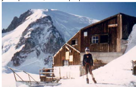
Le refuge des Cosmiques dans les années 60

Dans la Vallée Blanche, nous progressons dans une neige croûtée qui brise notre élan. Comme les pèlerins engagés dans la circumambulation du Mont Kailash, nous sommes à genoux tous les dix pas. Reprendre la station debout est un calvaire. Dès que l'espoir renaît à la perspective d'une neige plus ferme sur quelques pas, tout s'effondre à nouveau et nous manquons d'appuis sous la croûte pour nous redresser. A ce petit jeu épuisant, le temps passe.