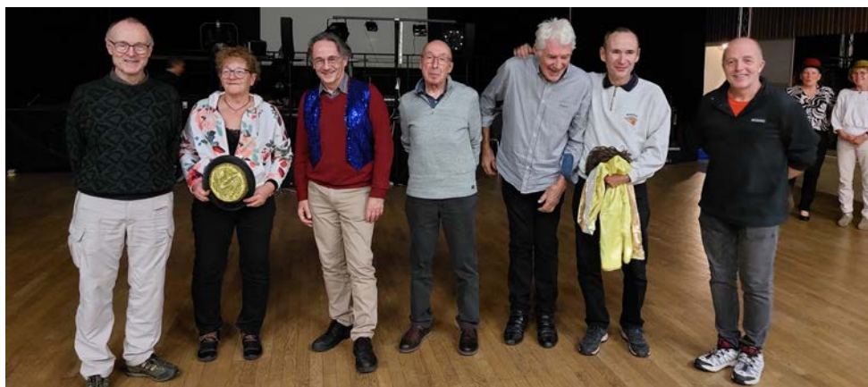
Les 7 présidents